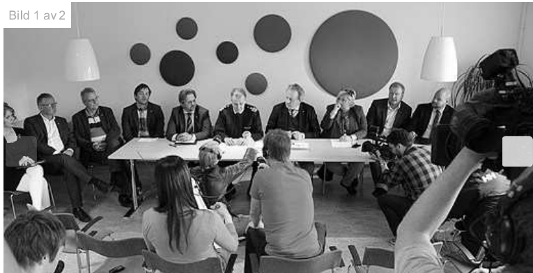
Kommunens presskonferens i CCC.

Det rådde fullständig politisk enighet inom Karlstad kommun bakom beslutet att köpa HA-gården i Härtsöga, som gjordes på exekutiv auktion i går.