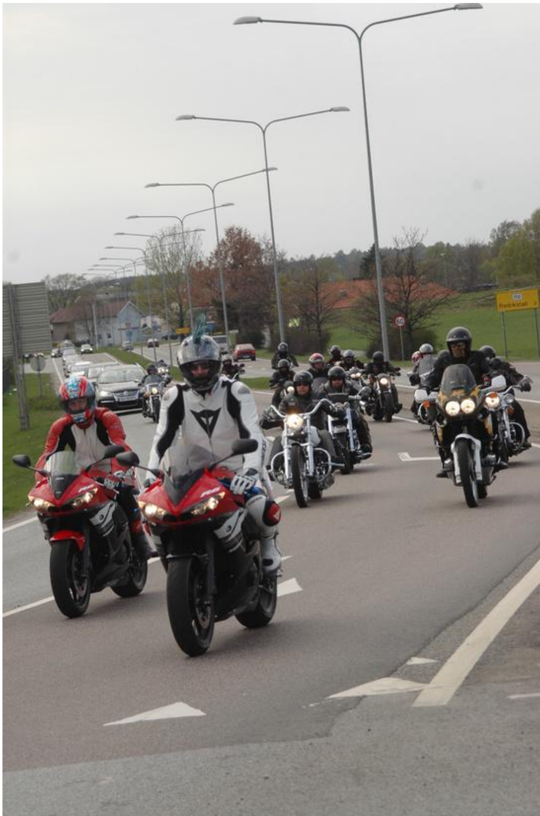
Fellestur med kortesje til Hvaler trakk flere hundre motorsyklister fra Fredrikstad sentrum til øyparadiset.