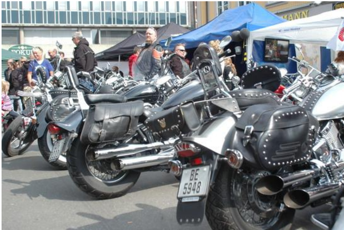
Fra 2000 til 2010 tiltrakk Planke-MC tusenvis av besøkende MC-folk fra store deler av Østlandet.